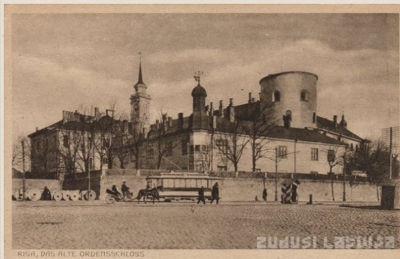
RIGA, DAS ALTE ORDENSSCHLOSS