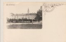
Rīgas pils. [1899?], Rīga