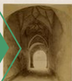
Rīgas pils vārtu velve. [189-?], Rīga

Meklēšana > Rīgas pils (atrasti 137 objekti)