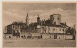
Rīgas pils, [1917?], Rīga

Atverot objektu, redzama plašāka informācija